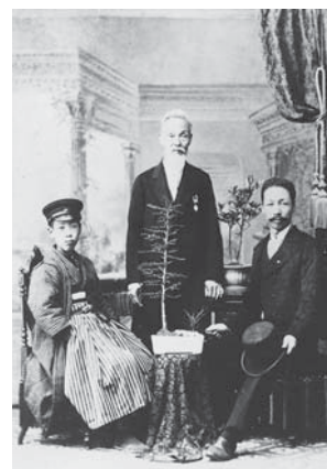
松本中学校入学記念（1897年）