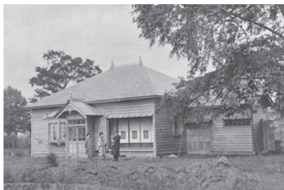
桑園博士村の田中邸(1913年頃)