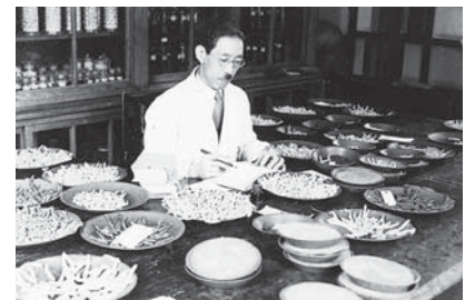
九州帝国大学にて(1937年)