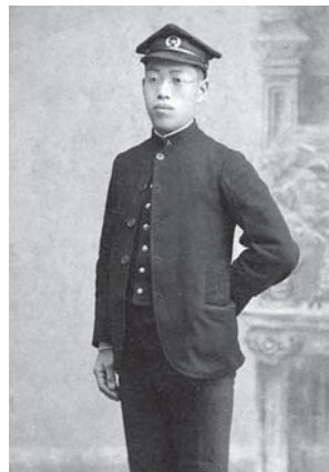
札幌農学校本科2年生(1906年)