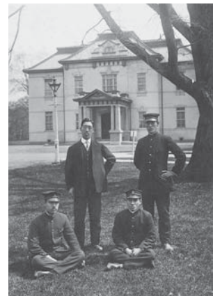
中央講堂前にて(1919年)