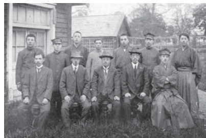
養蚕学教室の人々(1918年)