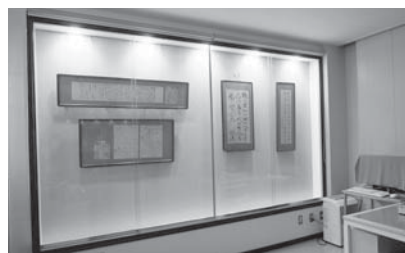
閲覧室での扁額展示

ひとえに願う、各家々が耕作に励んだ後に、実りの秋を迎えて、収穫の穀物が千個の釣り鐘のようにどっさりと得られることを。