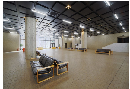
エントランス左より撮影