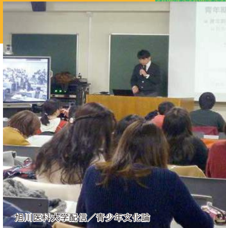
旭川医科大学配信 / 青少年文化論