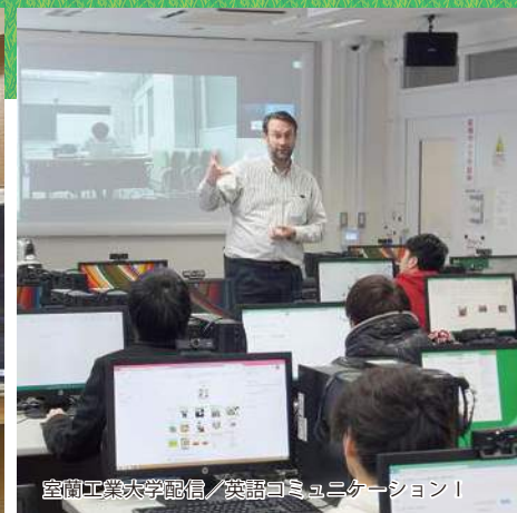
室蘭工業大学配信 / 英語コミュニケーションI