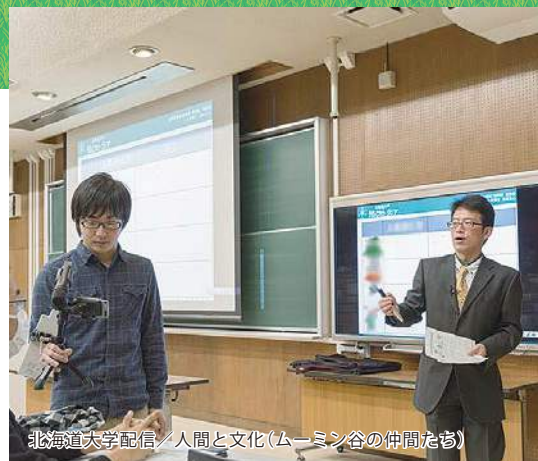
北海道大学配信 / 人間と文化(ムーミン谷の仲間たち)