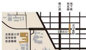
地下鉄南北線「北18条駅」より徒歩7分