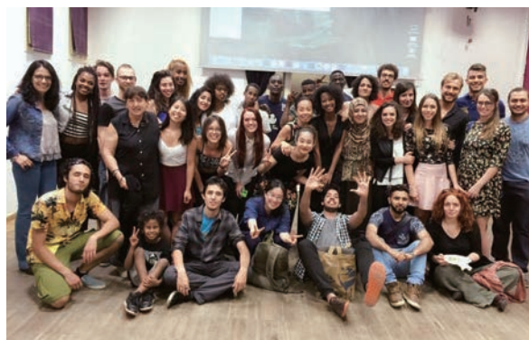
新渡戸カレッジ交換留学